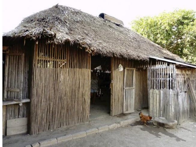
Fig. 11. La vivienda Tradicional en el caribe colombiano. Arteaga, R. (2019)

Sin embargo, los procesos constructivos de las casas tradicionales compuestas por bahareque y madera fueron un poco más trabajadas, y aún se encuentran actualmente en algunas partes de Cartagena, algunas tipologías están compuestas por un bloque central, en el centro localizado por una sala multifuncional y en sus extremos se ubicaban las habitaciones, de acuerdo con el ancho de la vivienda se podría adecuar más habitaciones. La cocina y comedor al igual que los baños eran localizadas en un bohío aparte de este primer bloque (Arteaga, 2019).