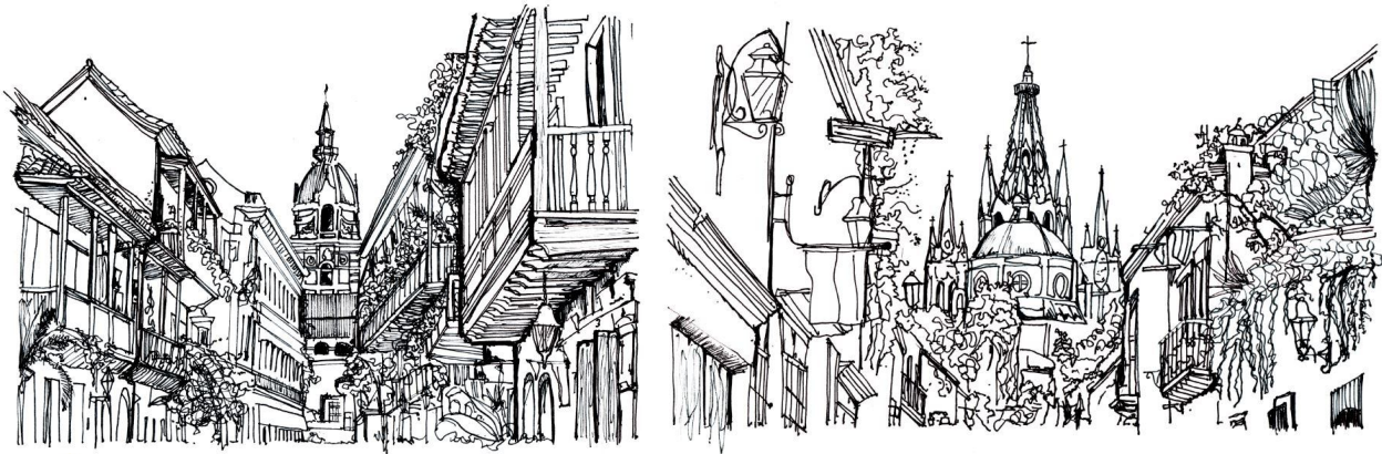
Fig. 2. Remate visual del centro histórico de Cartagena de Indias. Elaboración propia