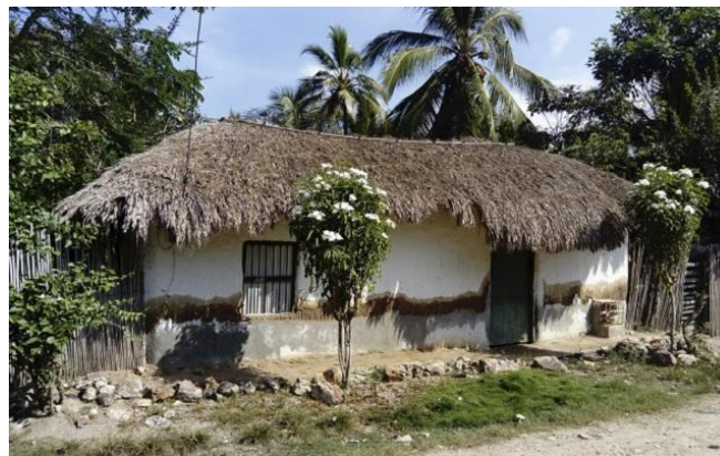
Fig. 12. La vivienda Tradicional en el caribe colombiano. Arteaga, R. (2019)

Sin embargo, los procesos constructivos de las casas tradicionales compuestas por bahareque y madera fueron un poco más trabajadas, y aún se encuentran actualmente en algunas partes de Cartagena, algunas tipologías están compuestas por un bloque central, en el centro localizado por una sala multifuncional y en sus extremos se ubicaban las habitaciones, de acuerdo con el ancho de la vivienda se podría adecuar más habitaciones. La cocina y comedor al igual que los baños eran localizadas en un bohío aparte de este primer bloque (Arteaga, 2019).