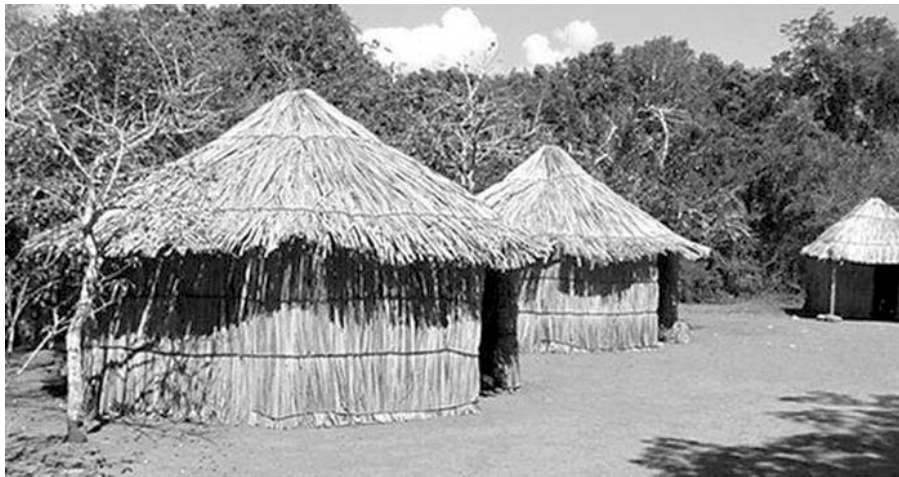
Fig. 10. Arquitectura Cartagenera: 5 siglos de historia. (2011)

Los orígenes de la arquitectura Cartagenera se pueden rescatar gracias al trabajo de las tribus indígenas “Los Mocanaes”, como lo resalta Arquitectura Cartagenera: 5 siglos de historia (2011). Esta comunidad se acentuó en la parte del caribe, los bohíos fueron las primeras manifestaciones de refugio de la comunidad, se componía de una primera planta hecha en tierra compactada y un solo espacio multifuncional; construido por una estructura en apoyos de madera y cerrados por medio de ramas o bejucos en bahareque, dejando un solo espacio (vano) como punto de acceso y creando una cubierta cónica en palma.