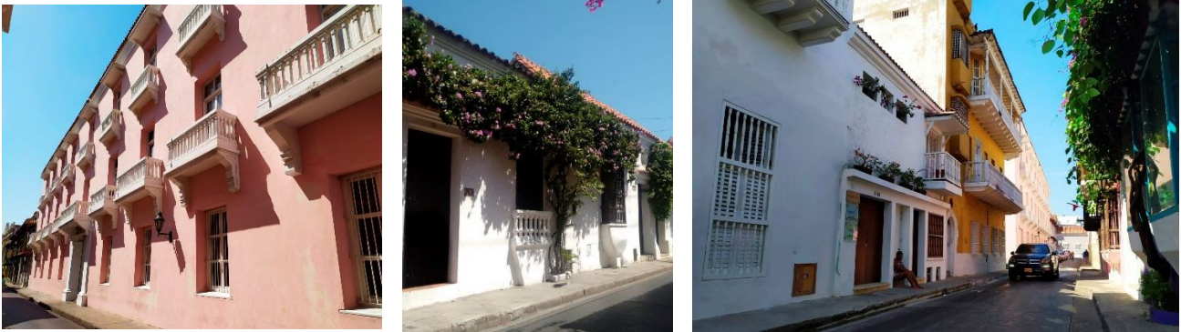
Fig. 7. Vivienda tipología en Cartagena de Indias. Fotografía tomada por Cerpa. E