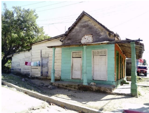
Fig. 13. La vivienda Tradicional en el caribe colombiano. Arteaga, R. (2019)

entre otros, permitieron popularizar estas viviendas y los elementos coloniales desarrollados por los artesanos locales (Arteaga, 2019).