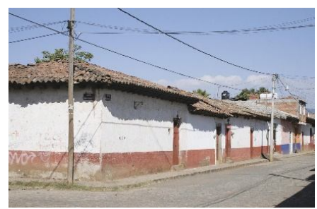
Fig. 14. La transformación de la vivienda vernácula. Exterior. Ettinger, C. (2010)