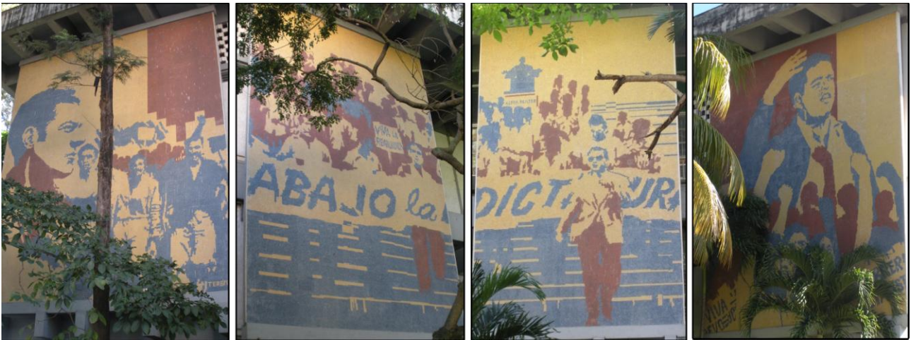
Fig. 3. Murales de las Luchas estudiantiles revolucionarias.