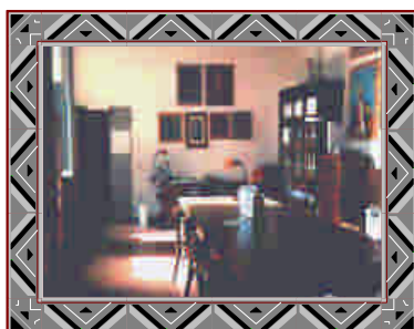
Archivio Contemporaneo "A. Bonsanti" Sala di consultazione

restauro, creato per il recupero dei volumi gravemente danneggiati dall'alluvione del 1966, il Centro Romantico, finalizzato allo studio e alla ricerca sulla civiltà ottocentesca e l'Archivio Contemporaneo, ora dedicato alla memoria di Bonsanti, ideato come luogo di conservazione di manoscritti, carteggi e biblioteche private di importanti personalità della cultura novecentesca. La biblioteca continua a essere incrementata secondo i criteri originari.