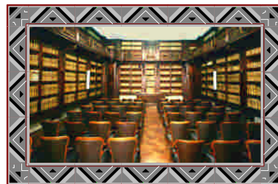
Palazzo Strozzi Sala Ferri

Nel corso del '900 la sua attività è proseguita sotto la guida di letterati illustri come Bonaventura Tecchi, Eugenio Montale e, per circa quarant'anni, Alessandro Bonsanti. Durante la direzione di quest'ultimo, nascono tre nuovi settori: il Laboratorio di