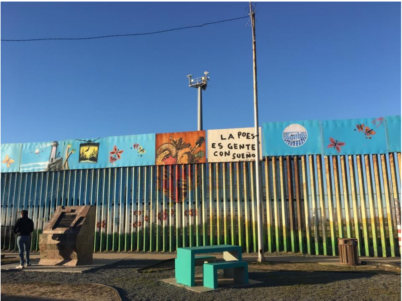
Fig.3. Mural Ciudad de Hermandad. (foto por Enrique Chiu, 2016)