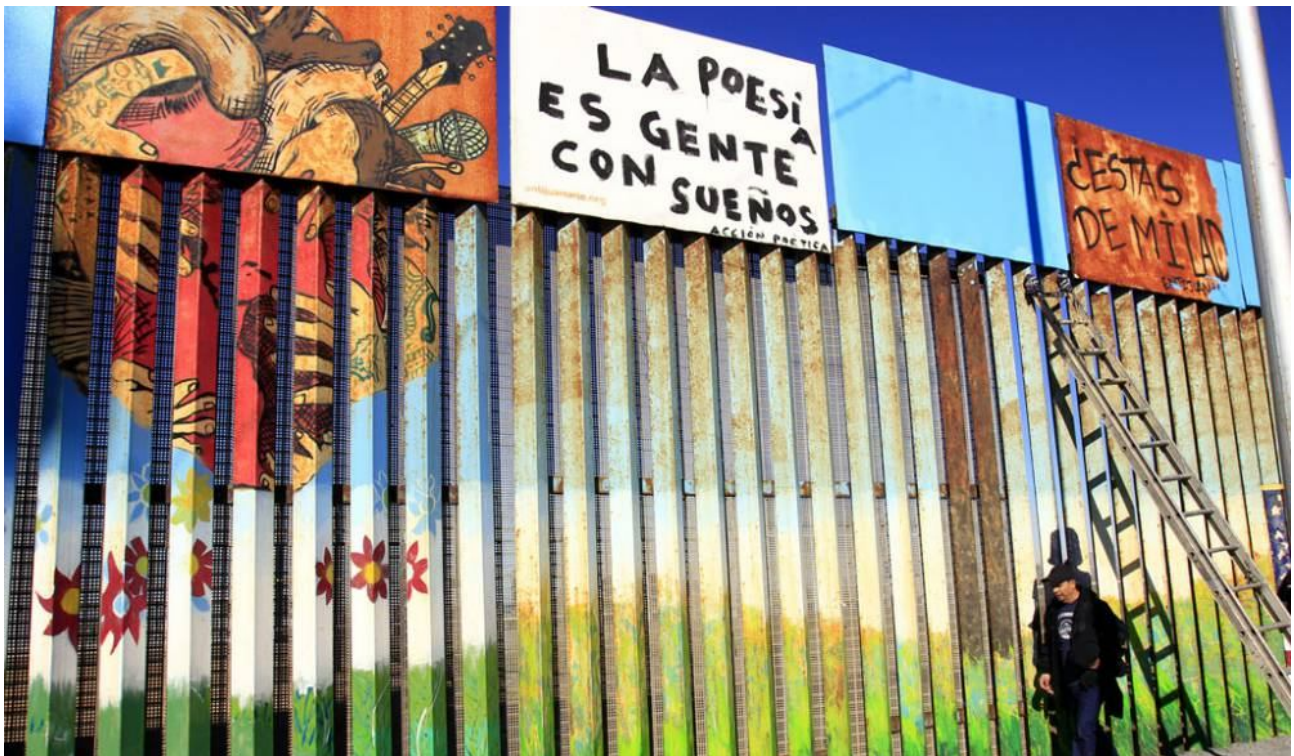
Fig. 1. Mural Ciudad de Hermandad (Enrique Chiu, 2016)

Una entrevista con Enrique Chiu, artista mexicano, que desde varios años trabaja con otros artistas en la frontera entre México y Estados Unidos. Hemos hablado con el con respecto al tema del dialogo intercultural entre México y Norte America.